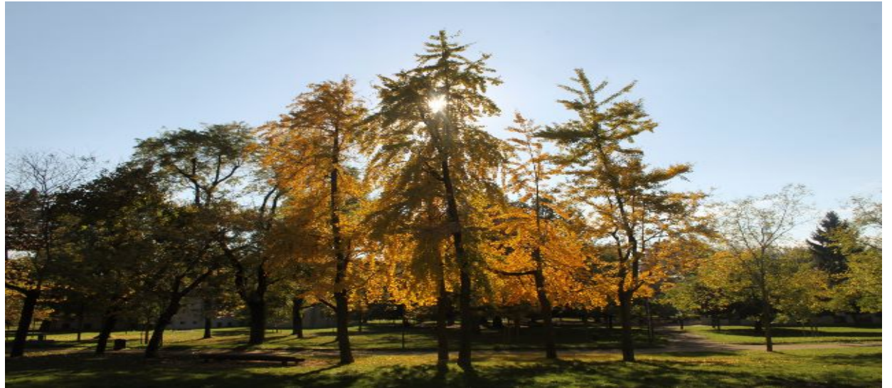
La luce, esercitazione fotografia classi aperte terze